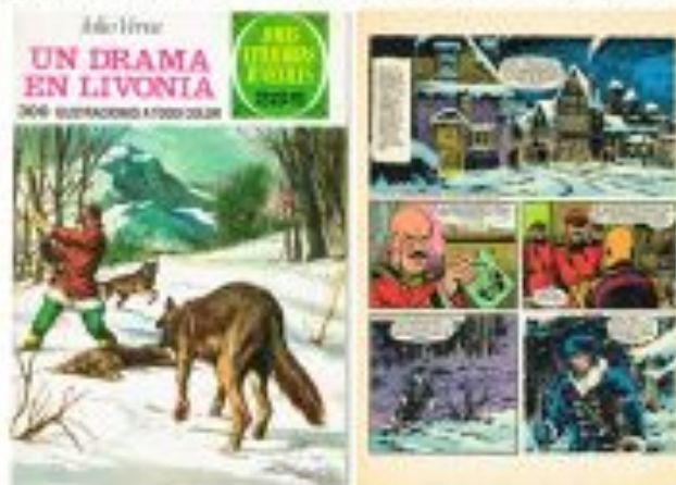
2) Comic: Un drama en Livonia (Spanien 1976), Nr. 161 der Serie Joyas Literarias Juveniles , erschienen im Verlag Bruguera, Texter: Jose Antonio Vidal Sales, Zeichner: Tomas Pesto Del Vado, Farben: Antonio Bernal Romero, 30 Seiten. 7