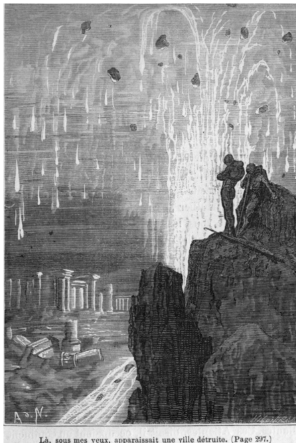
Là, sous mes yeux, apparaissait une ville détruite. (Page 297.)

... le capitaine Nemo, accoudé sur une stèle moussue, demeurait immobile et comme pétrifié dans une muette extase. Songeait-il à ces générations disparues et leur demandait-il le secret de la destinée humaine ? Était-ce à cette place que cet homme étrange venait se retremper dans les souvenirs de l'histoire et revivre de cette vie antique, lui qui ne voulait pas de la vie moderne ?